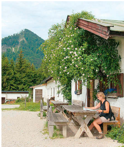
An der Hofalm; hinten der Riesenberg